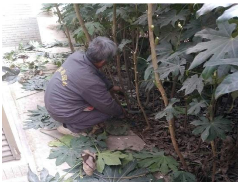
春光明媚，百花齐放。