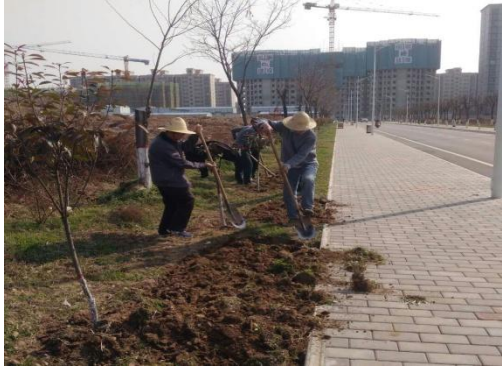
15、清除环校东路蔷薇旁杂草。