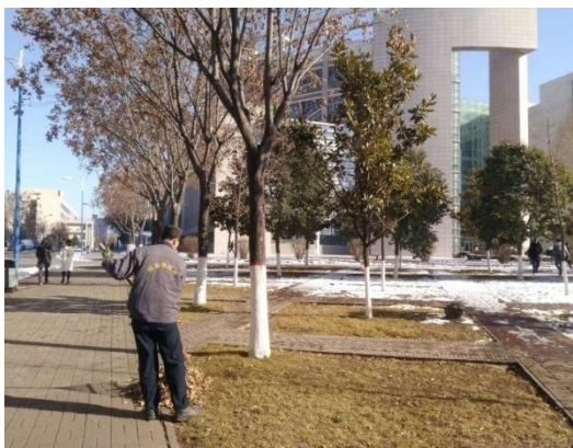
6、教学楼 F 区西门口花坛移栽黄杨元球。