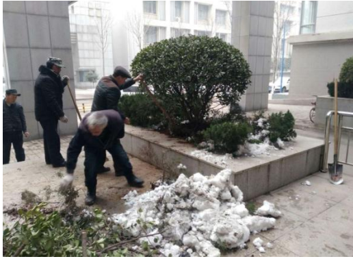
7、清除教学楼周边花坛中杂草杂苗。