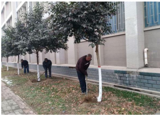
8、修剪七叶树大道大叶女贞树。