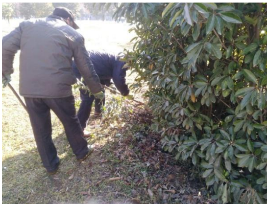
5、修剪教学楼 A、E 区通道龙柏树，清除活动中心大草坪杂物杂苗。