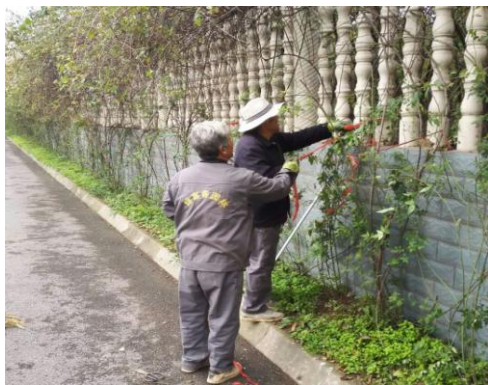
9、图书馆西侧移栽桂花树。