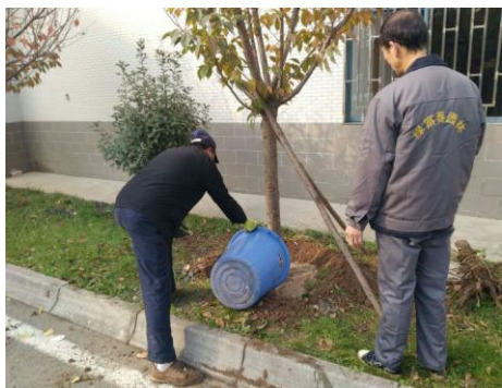
13、一号公寓楼东樱花大道移栽樱花树。