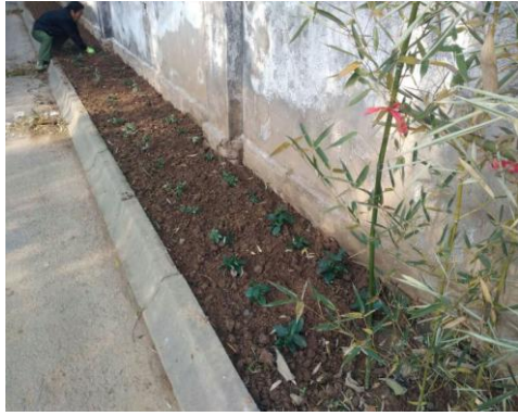
11、教学楼 A 区北侧整地，将部分较好的草皮移植到 B 区北侧路口。