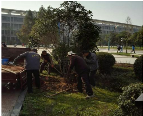
10、环校北路栽种金银花苗和剑兰。