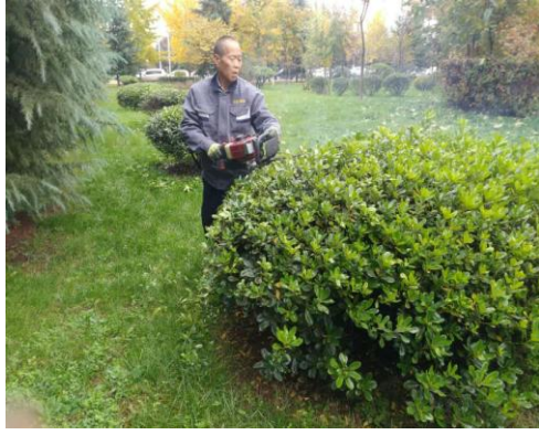
8、东环校路蔷薇清除干枝补苗。