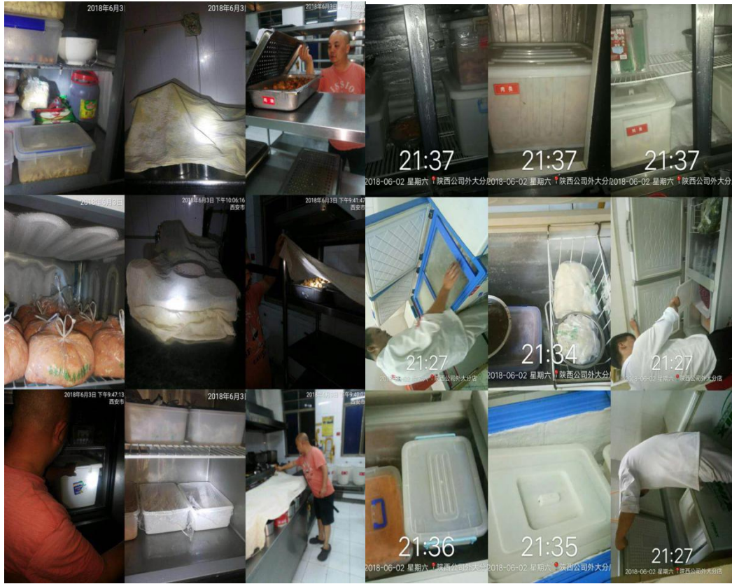
5、各餐厅周末大扫除。