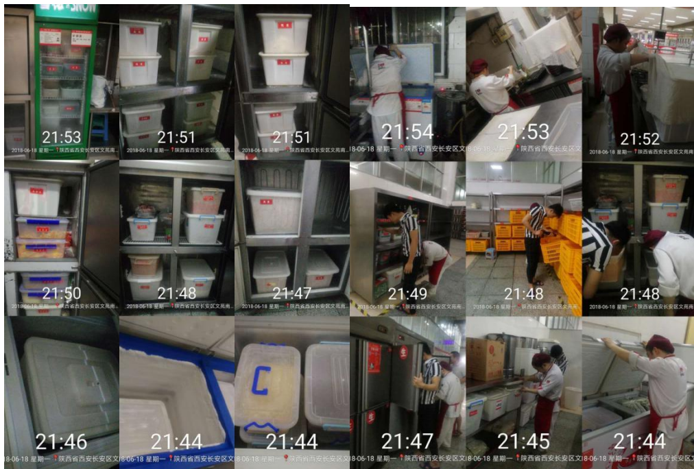
6、各餐厅进行卫生大扫除，清理卫生死角。