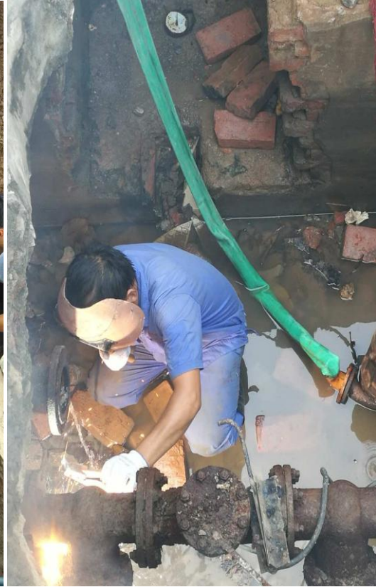
长安校区进出水管道检修