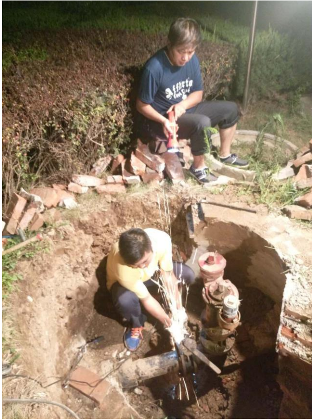
长安校区连夜检修更换 消防设施