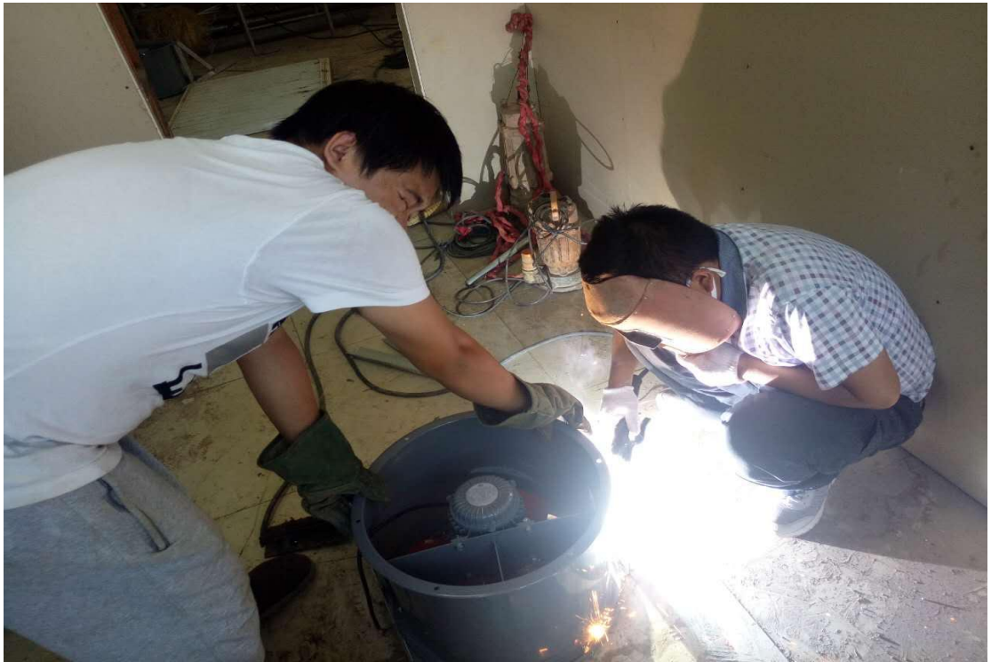
长安浴室安装排风扇材料准备