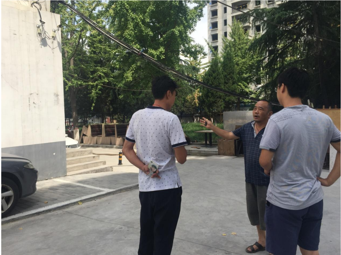
雁塔 3 号食堂电缆敷设方案讨论