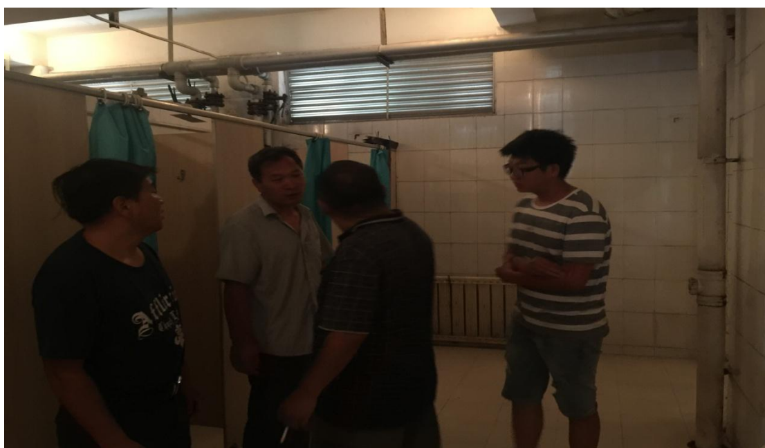
长安浴室排风扇安装前期检查