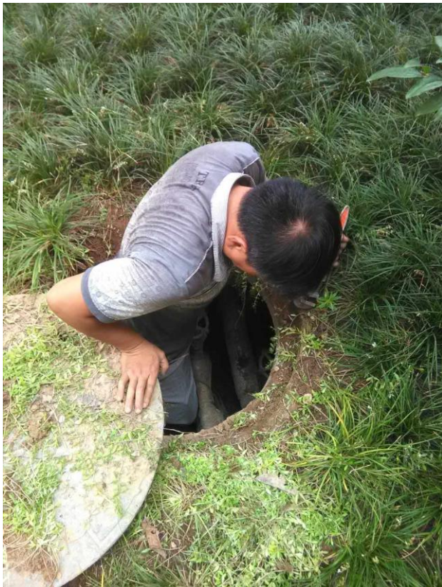
长安校区检修下水管道