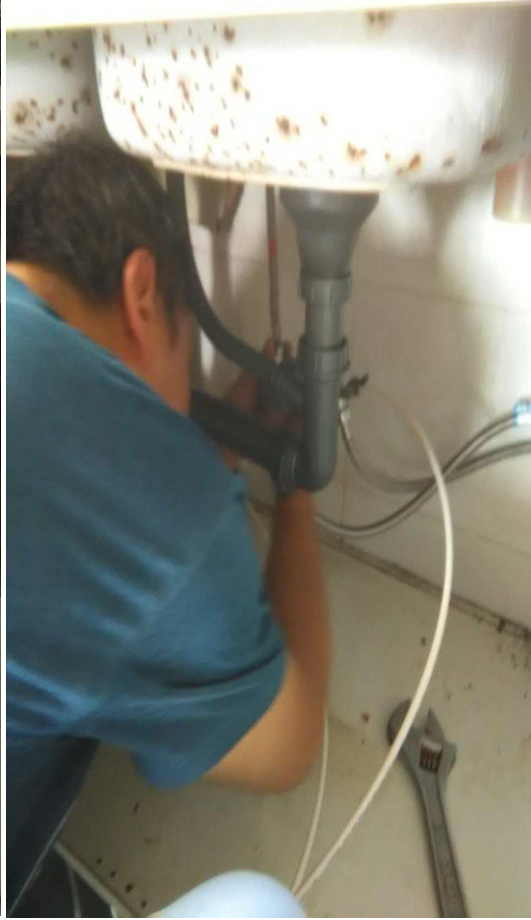
长安校区南区教师家中维修下水管道