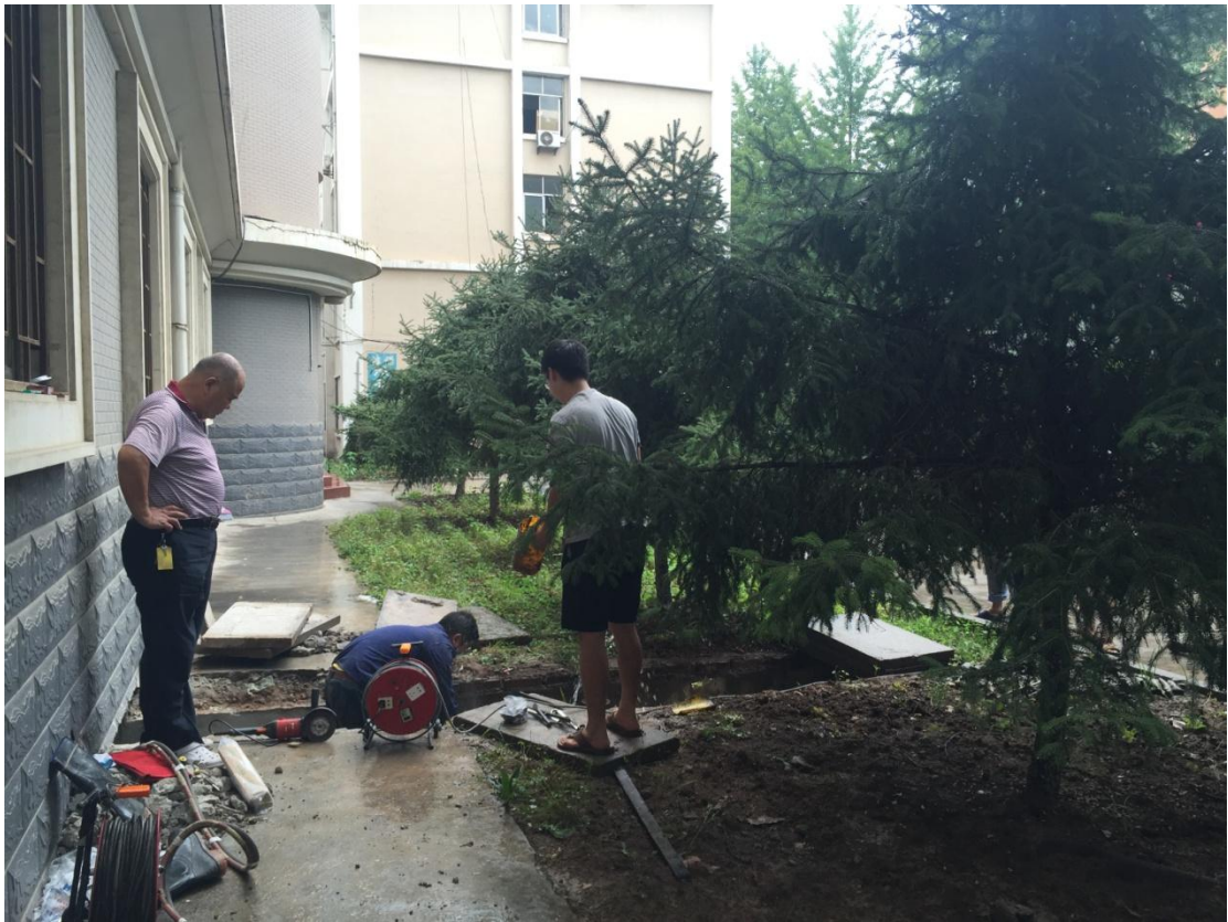
雁塔五号公寓楼下水管更换