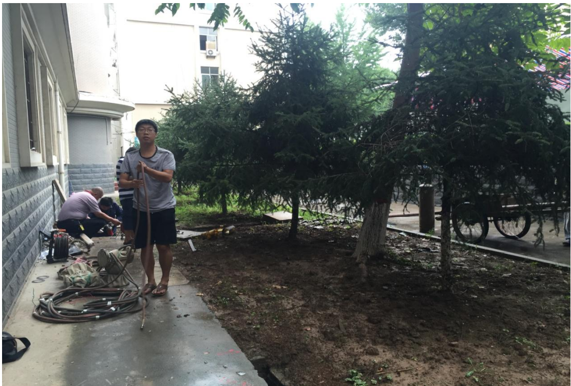
雁塔五号公寓楼下水管更换准备